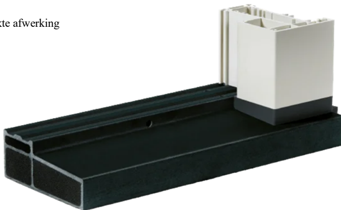
Voorbeeld Buva onderdorpel. (ander type)